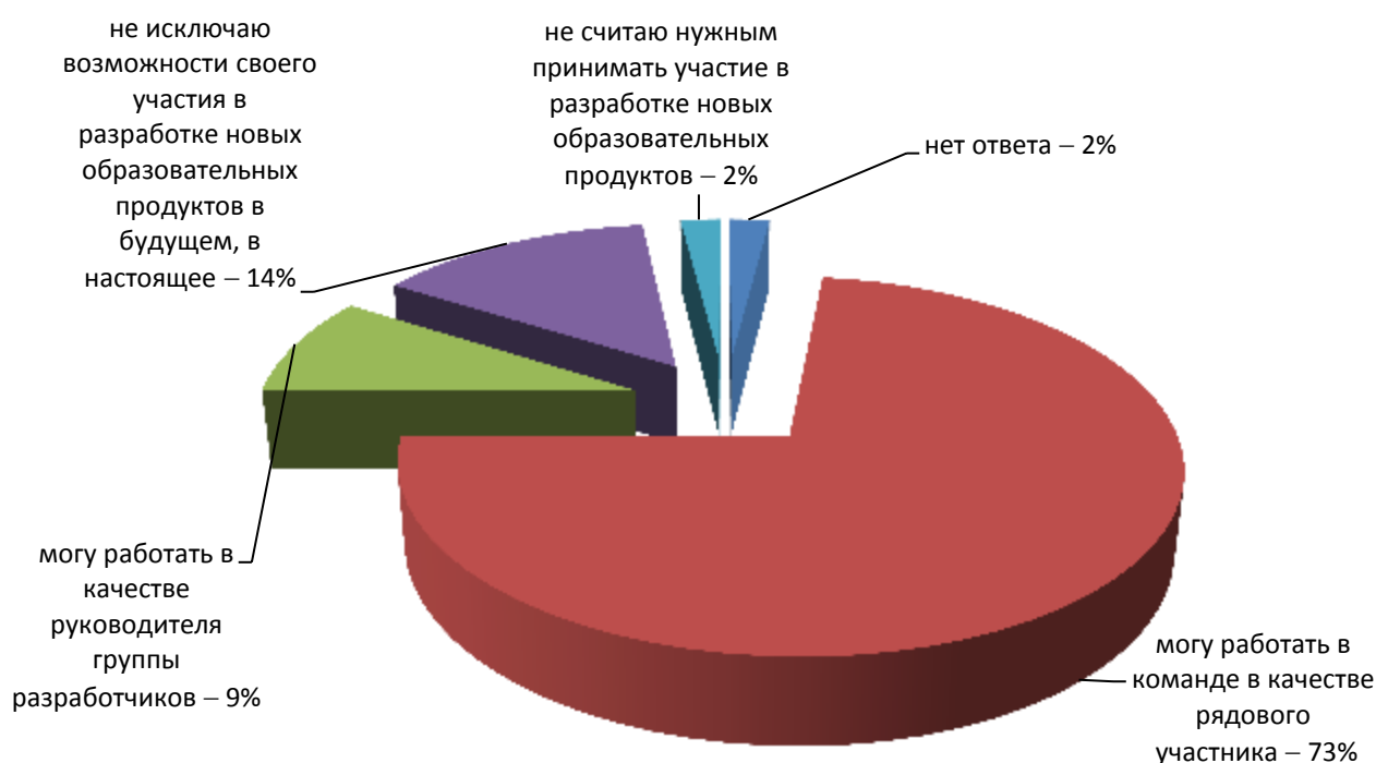
Рисунок 2 – Оценка степени участия педагогов в разработке новых образовательных продуктов

Большинство опрошенных, около 73%, видят себя в качестве рядовых участников процесса, и лишь 9% могут работать в качестве руководителей группы разработчиков. Такое процентное распределение вполне понятно. Определилась группа лидеров, готовых руководить инновационной деятельностью в коллективе.