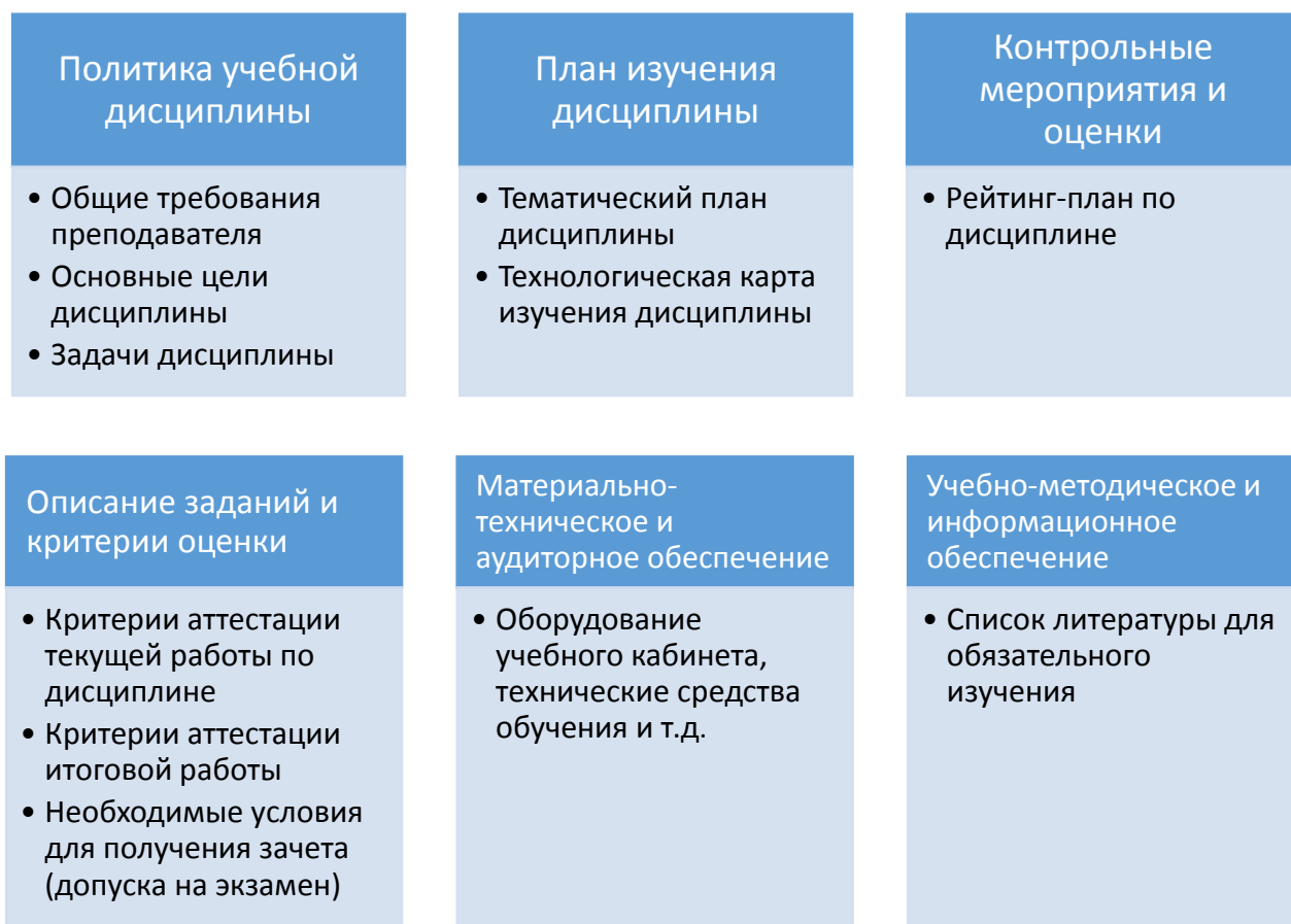
Рисунок 1 – Основные разделы курса

Задачи дисциплины. Задачи – это конкретное выражение цели, ответ на вопрос: с чем знакомит, чему научит, что вырабатывает данная дисциплина.