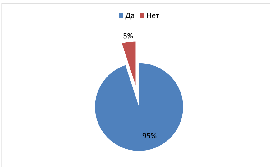
Рисунок 2 – Результаты анкетирования студентов – бакалавров по физической культуре по вопросу «Как Вы считаете, необходимы ли для вашей будущей профессиональной деятельности компетенции, связанные с тренерской деятельностью?» /

Figure 2 – The results of the survey of students – bachelors in physical culture on the question "Do you think that competencies related to coaching activities are necessary for your future professional activity?"