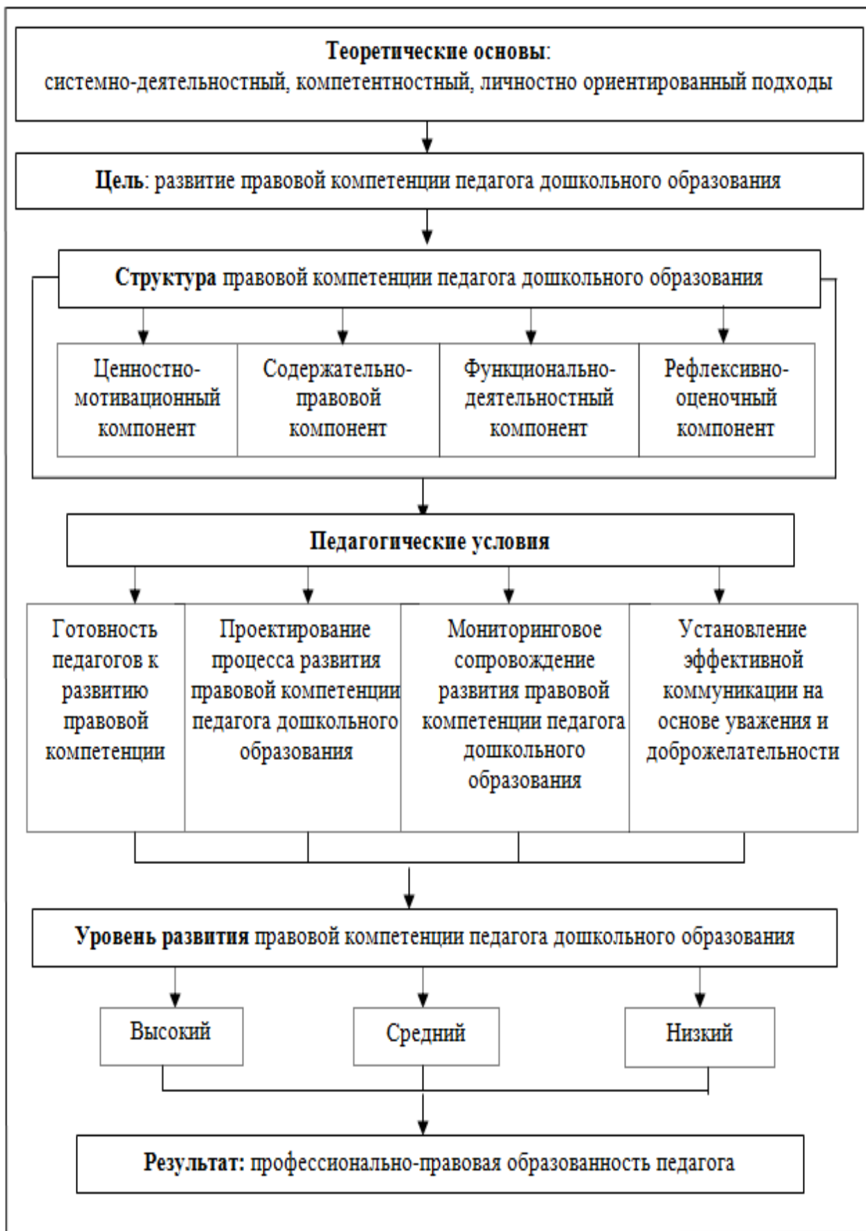
Рисунок 2 – Модель развития правовой компетенции педагога дошкольного образования