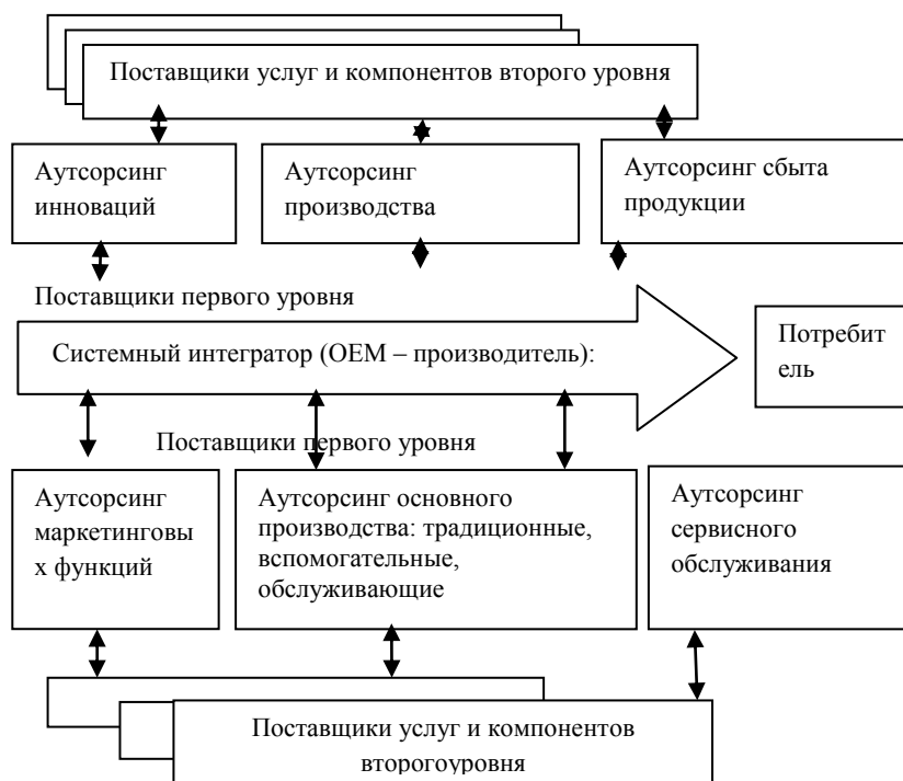
Рисунок 2 – Модель сетевой структуры промышленного парка [7]

использование договорных соглашений при осуществлении производственной деятельности между поставщиками компонентов и системным интегратором, осуществляющим выпуск конечной продукции и управление всей производственной цепочкой. Модель сетевой структуры промышленного парка представлена на рисунке 2.